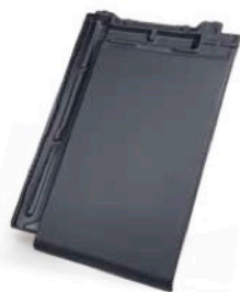
▲ Płaska powierzchnia dachu